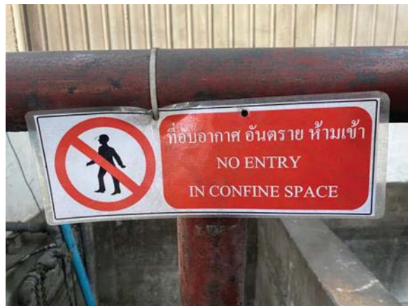
ภาพที่ 29 ป้ายเตือนบริเวณพื้นที่เสี่ยงอันตราย