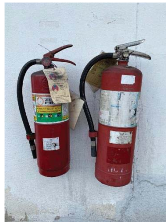
ภาพที่ 43 ถังดับเพลิงแบบมือถือ