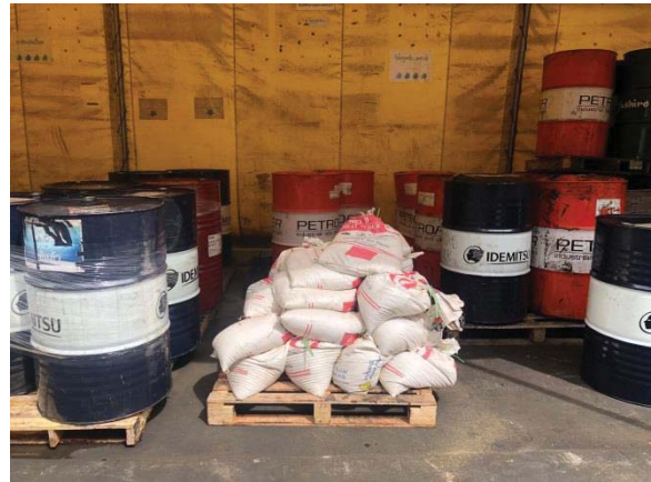
ภาพที่ 21 วัสดุดูดซับน้ำมัน (กรณีการหกรั่วไหลของน้ำมัน)