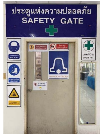
ภาพที่ 3 ป้ายเตือนสวมใส่อุปกรณ์ป้องกันส่วนบุคคล