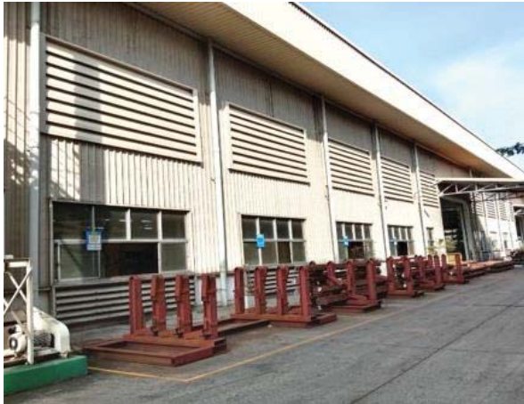
ภาพที่ 26 ระบบระบายอากาศในพื้นที่ปฏิบัติงาน