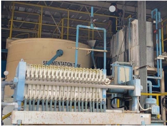
ภาพที่ 8 ระบบบำบัดน้ำเสีย