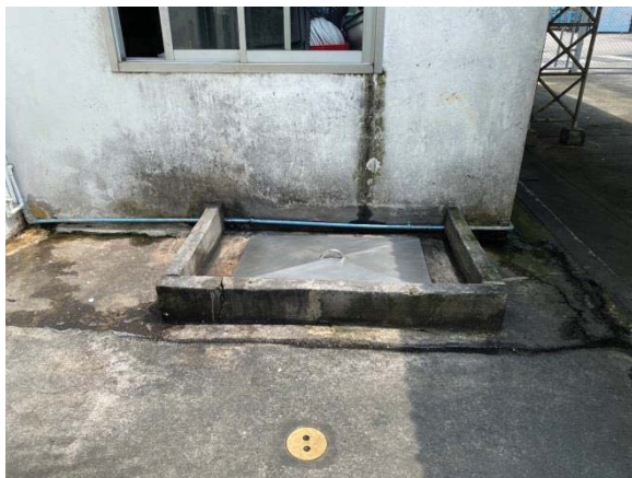
ภาพที่ 12 ถังดักไขมัน