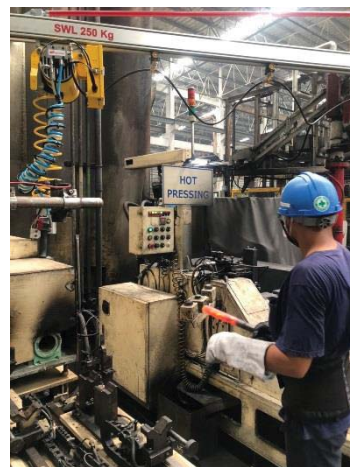
ภาพที่ 35 พื้นที่ติดตั้งเครื่องจักรที่มีความร้อน