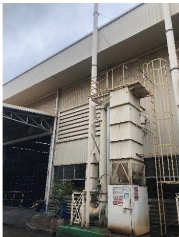
Dust Collector G.1 Forging 4