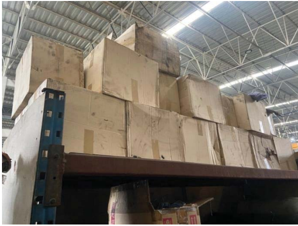
ภาพที่ 2 การสำรองถงกรองของระบบดักฝุ่น