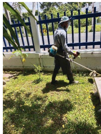
ภาพที่ 19 การดูแลพื้นที่สีเขียว