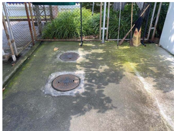
ภาพที่ 11 ระบบบำบัดน้ำเสียสำเร็จรูปชนิดเกรอะ-กรองไร้อากาศ