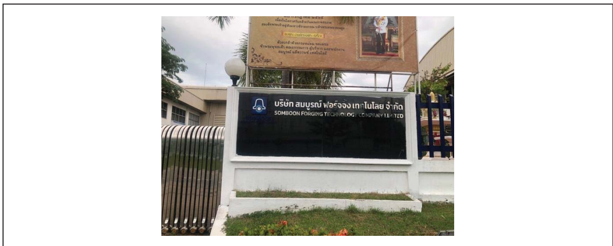
2.ภาพถ่ายป้ายชื่อโรงงาน