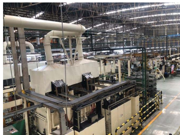
ภาพที่ 5 พื้นที่ติดตั้งเครื่องจักรภายในอาคารที่เป็นพื้นที่ปิด