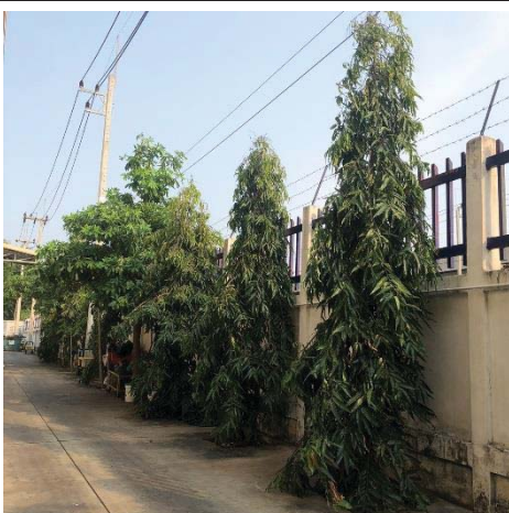
ภาพที่ 6 การปลูกต้นไม้ยืนต้นเป็นแนวป้องกันเสียงบริเวณริมรั้ว