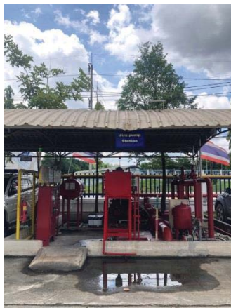
ภาพที่ 42 เครื่องสูบน้ำดับเพลิงและหัวรับน้ำ ดับเพลิง