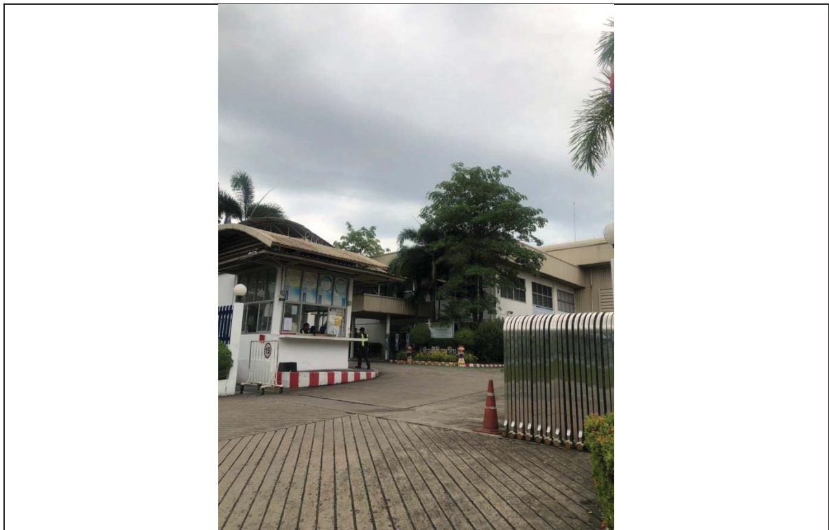
3.ทางเข้า-ออก ด้านหน้าโรงงาน