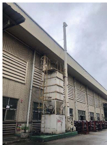
Dust Collector G.8 Forging 3

ภาพที่ 1 ปล่องหม้อน้ำ และระบบดักฝุ่นแบบถุงกรอง