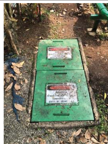
ภาพที่ 7 บ่อตรวจวัดคุณภาพน้ำ (inspection manhole)