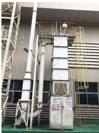
Dust Collector G.1 Forging 5 (New)

ภาพที่ 1 ปล่องหม้อน้ำ และระบบดักฝุ่นแบบถุงกรอง (ต่อ)