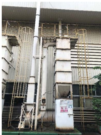
Dust Collector G.1 Forging 3