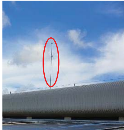
ภาพที่ 39 สายล่อฟ้าภายในพื้นที่โครงการ