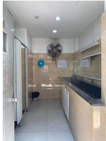
ภาพที่ 27 ห้องสุขา