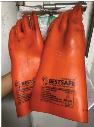
ภาพที่ 40 ถุงมือยางกันไฟฟ้า/ ฉนวนหุ้มสายยาง