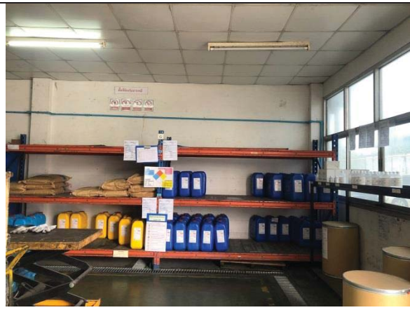
ภาพที่ 41 พื้นที่จัดเก็บสารเคมี