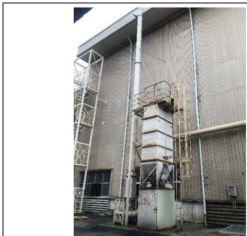
Dust Collector G.8 Forging 2