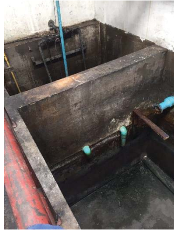
ภาพที่ 9 บ่อพักน้ำทิ้ง