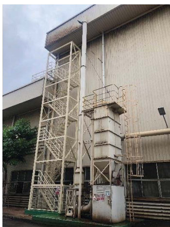
Dust Collector G.8 Forging 4