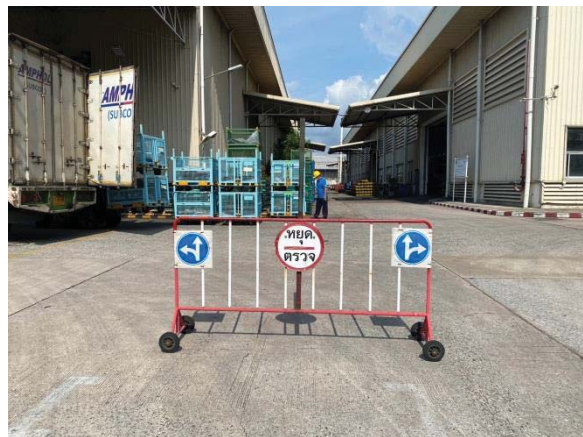
ภาพที่ 13 ข้อกำหนดการขับขี่ยานต์ภายในบริษัทฯ