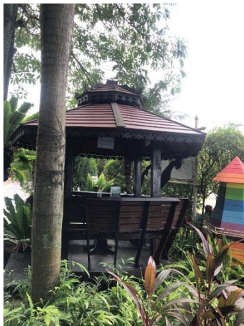
ภาพที่ 28 พื้นที่พักผ่อน