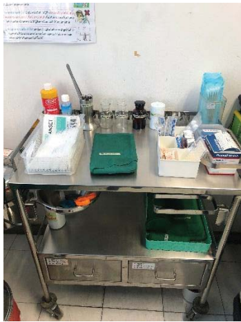
ภาพที่ 32 อุปกรณ์ปฐมพยาบาลเบื้องต้น