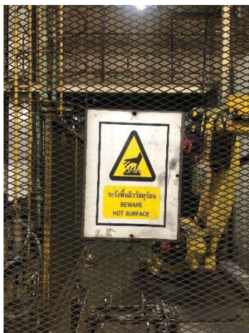
ภาพที่ 34 ป้ายเตือนอันตรายเกี่ยวกับความร้อน