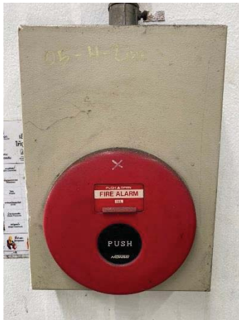
ภาพที่ 20 ระบบแจ้งเหตุเพลิงไหม้