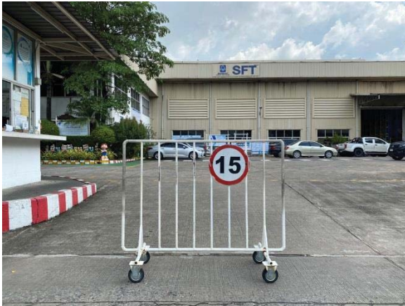
ภาพที่ 16 ป้ายจำกัดความเร็วภายในพื้นที่โครงการ