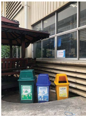
ภาพที่ 22 ถังรองรับขยะมูลฝอยแยกประเภท