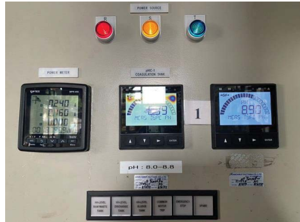
ภาพที่ 15 เครื่องตรวจวัด pH แบบอัตโนมัติ