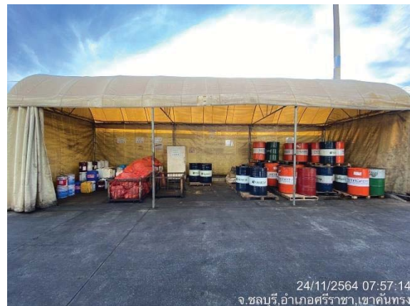
ภาพที่ 23 อาคารเก็บของเสีย