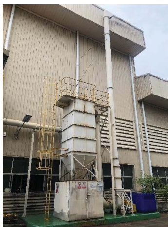
Dust Collector G.8 Forging 5 (New)