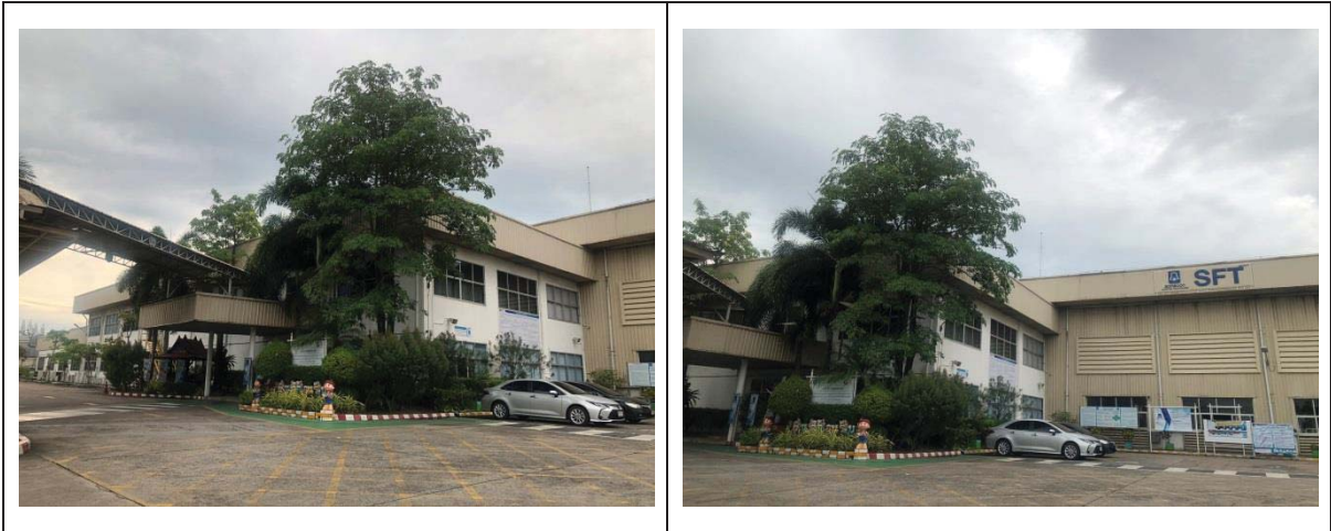
1.ภาพถ่ายพื้นที่โรงงาน