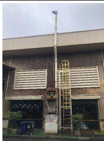
Dust Collector G.1 Forging 2