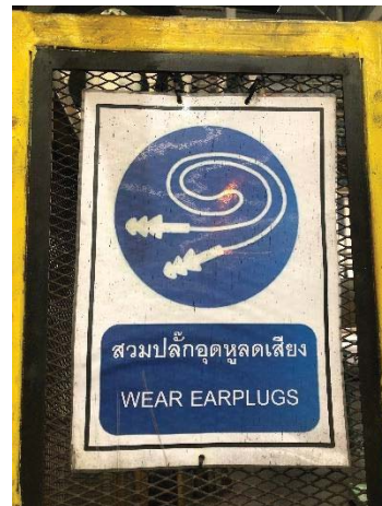
ภาพที่ 37 ป้ายเตือนพื้นที่เสียงดัง