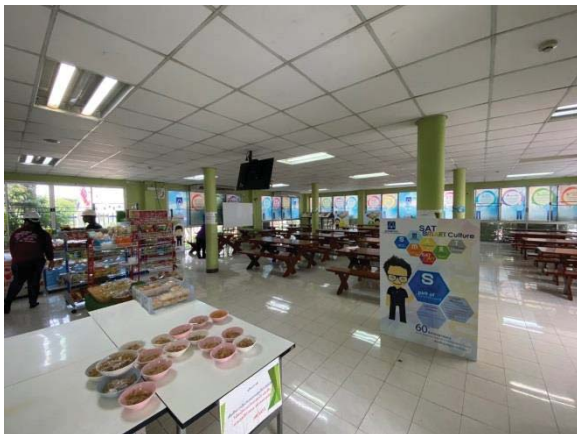
ภาพที่ 24 โรงอาหารที่ถูกสุขลักษณะ