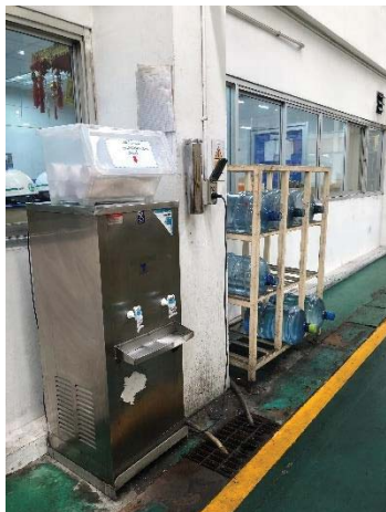
ภาพที่ 36 น้ำเย็น และเก้าอี้สำหรับพนักงาน