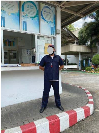
ภาพที่ 14 เจ้าหน้าที่รักษาความปลอดภัย ทางเข้า - ออกพื้นที่โครงการ