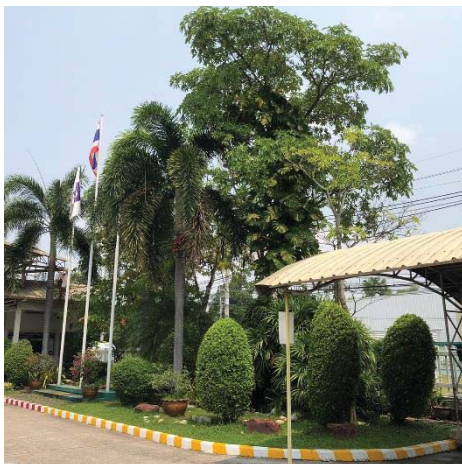
ภาพที่ 18 พื้นที่สีเขียว