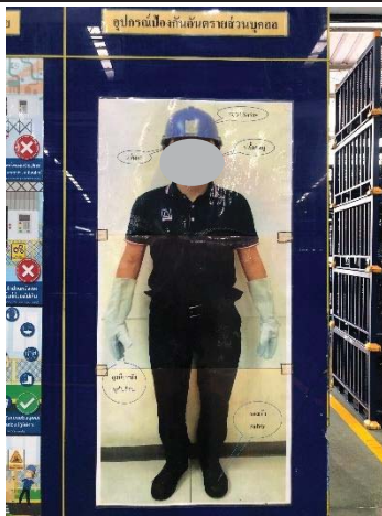
ภาพที่ 4 การสวมใส่อุปกรณ์ป้องกันส่วนบุคคล