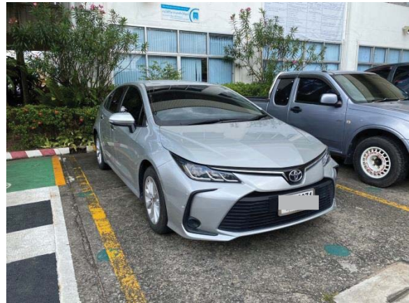
ภาพที่ 33 รถสำรอง