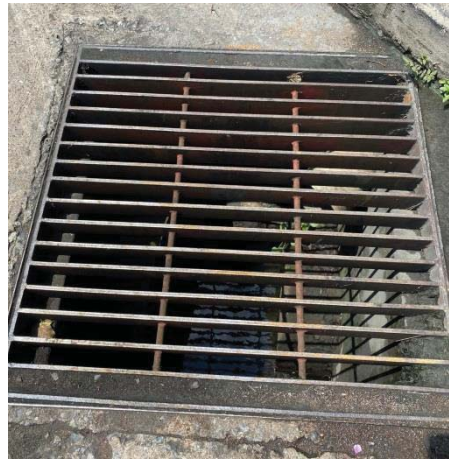
ภาพที่ 17 รางระบายน้ำฝน