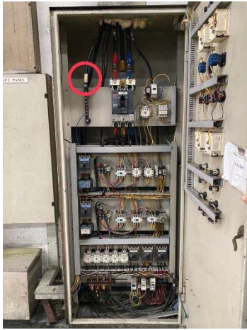
ภาพที่ 38 อุปกรณ์ไฟฟ้ามีสายดินทุกระบบ