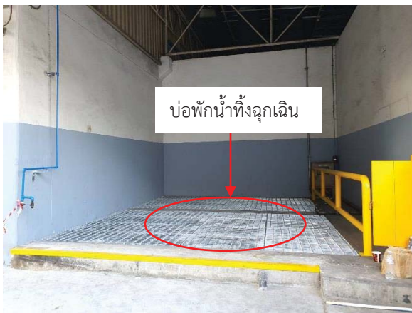
ภาพที่ 10 บ่อพักน้ำทิ้งฉุกเฉิน