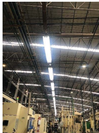
ภาพที่ 25 แสงสว่างในพื้นที่ปฏิบัติงาน